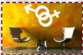
Atelier animé par : Fabrice Ricard

Elle est l'exemple vivant et concret des possibilités de fusion artistique. Ce spectacle traite dans l'humour les rapports hommes/femmes avec des comédiens et comédiennes adultes dans une mosaïque de nationalité.